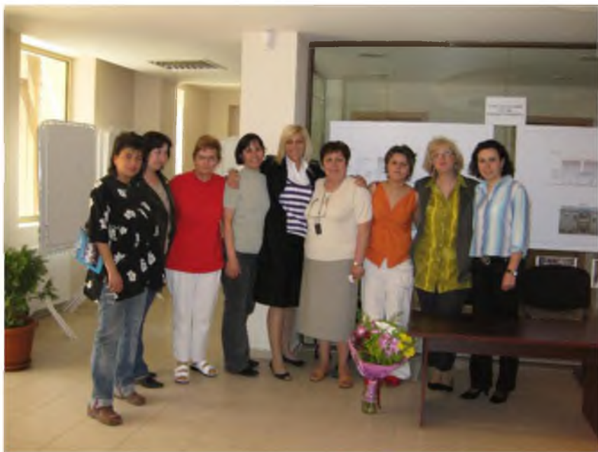
Колективът на БИЦ при откриване на новата сграда – 2009 г.

химици, еколози, електроника и полупроводникови технологии, индустриален мениджмънт, библиотекостроителство и научна информация.